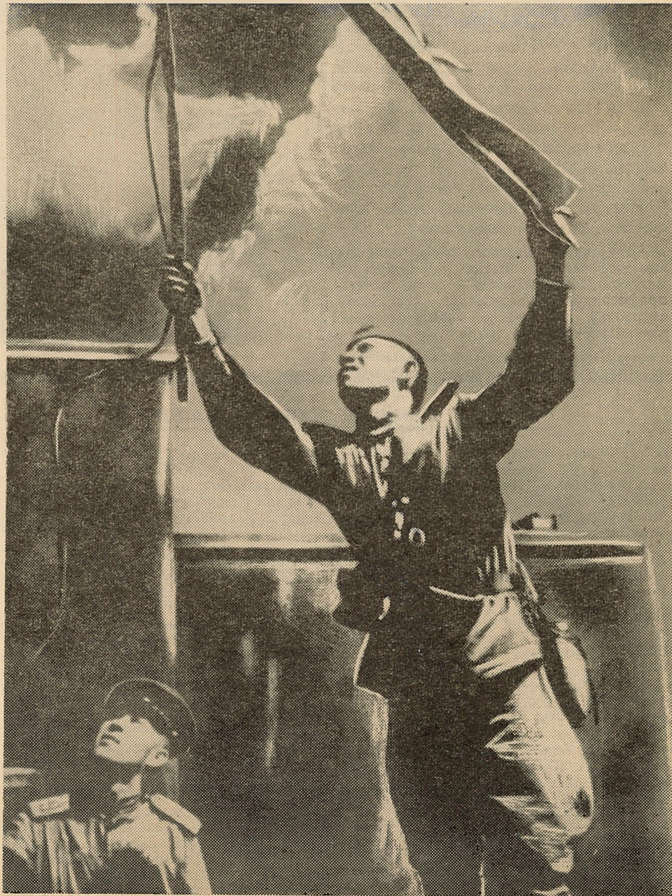
Падняцце Чырвонага Сцяга над Домам Урада ў г. Мінску. Жнівень 1944 года.

«Правда», 3 мая 1967 года № 123. (17805).